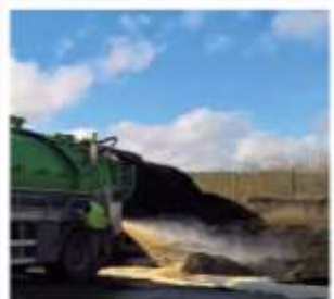
ASSAINISSEMENT : 40 % DES DÉCHETS TRAITÉS