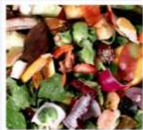
DÉCHETS ALIMENTAIRES : 20 % DES DÉCHETS TRAITÉS