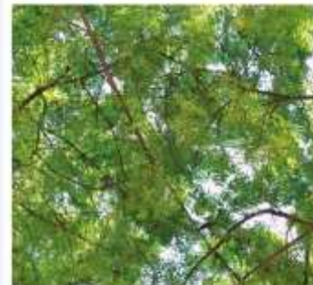
DÉCHETS VERTS : 40 % DES DÉCHETS TRAITÉS